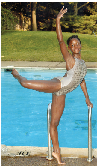
Dansen bij het zwembad nadat ik het record rugslag van de Tri-County Swim League had verbeterd.