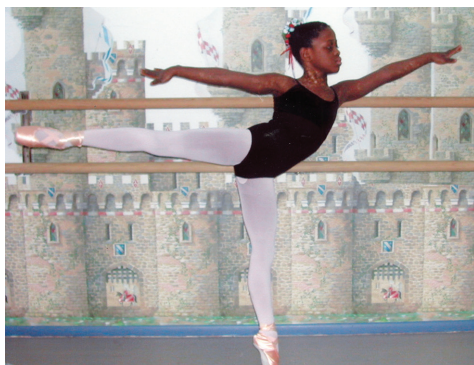
Arabesken oefenen in mijn slaapkamer, op mijn nieuwe spitzen.