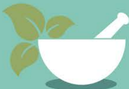
Stamper en vijzel om gedroogde planten te vermalen tot medicijnen

Door de jaren heen zijn er veel medicijnen uit bomen en planten onderzocht. Mensen ontdekten welke werkzame stoffen erin zitten en waar je ze voor kunt gebruiken. Nog steeds worden planten bestudeerd in de hoop dat er nieuwe geneeskrachtige stoffen worden gevonden.