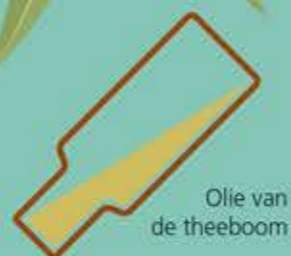
Olie van de theeboom

Ook chimpansees gebruiken planten als medicijn. Ze eten bladeren om ontstekingen te genezen, en de schors van een vijgenboom als ze diarree hebben!